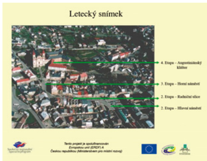
Obr. 2: Letecký snímek – etapizace projektu regenerace a revitalizace centra města