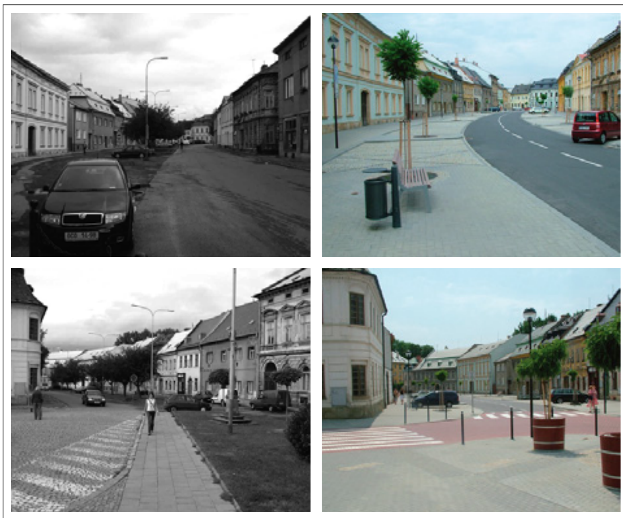
Obr. 3: První etapa – Ulice Bezručova před a po revitalizaci

mariánského sloupu jako důstojného nástupního prostoru pro hlavní cíle turistických návštěv – hrad Šternberk a objekt bývalého augustiniánského kláštera. V rámci náměstí je upravena stávající dopravní situace tak, aby byly koridory a plochy pro dopravu jednoznačně vymezeny a odděleny od širokých ploch pro pěší. Požadavkem bylo především vrátit náměstí reprezentativní a společenskou funkci v návaznosti na památkově chráněné dominanty města, především národní kulturní památku hrad Šternberk, kostel, bývalý augustiniánský klášter a mariánský sloup při současném zajištění dopravní obslužnosti a bezpečnosti. V prostoru před gymnáziem bylo instalováno pítko, u výjezdu z náměstí směrem k ulici Opavská byla odkryta a opravena historická studna. Viz obr. 5.