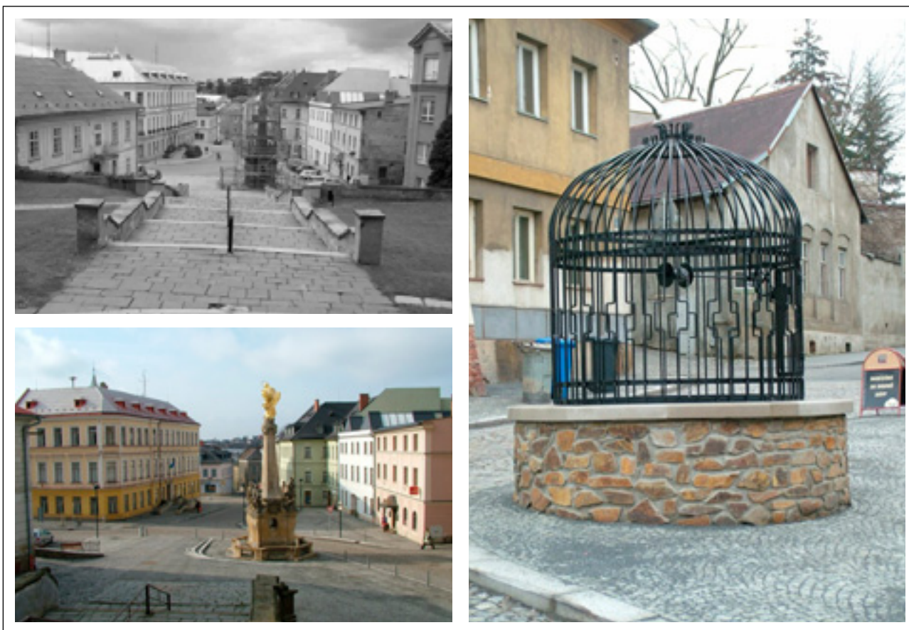
Obr. 5: Třetí etapa – Horní náměstí před a po revitalizaci