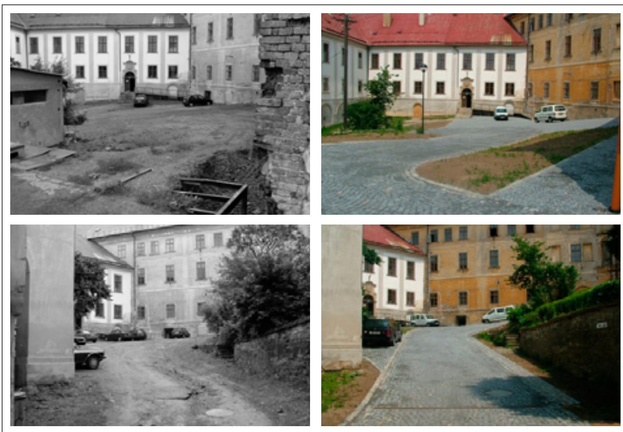
Obr. 6: Čtvrtá etapa – Nádvoří bývalého augustiniánského kláštera před a po úpravách