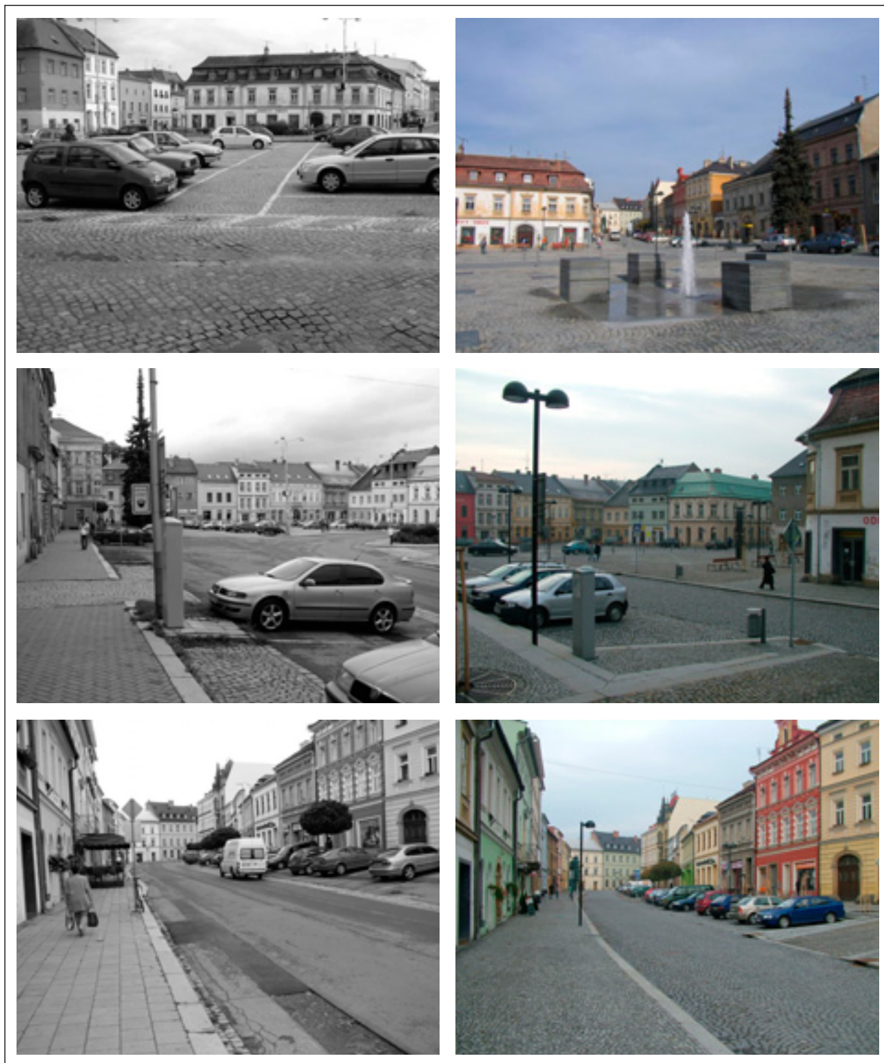
Obr. 4: Druhá etapa – Hlavní náměstí a ulice Radniční před a po revitalizaci

využíván aktivně, ale pouze sezónně pro škálu uměleckých aktivit výtvarných, divadelních a koncertních. Čtvrtá etapa projektu spolufinancovaného Evropskou unií řešila úpravu plochy nádvoří a komunikačně zpřístupnila celý areál. Viz obr. 6.